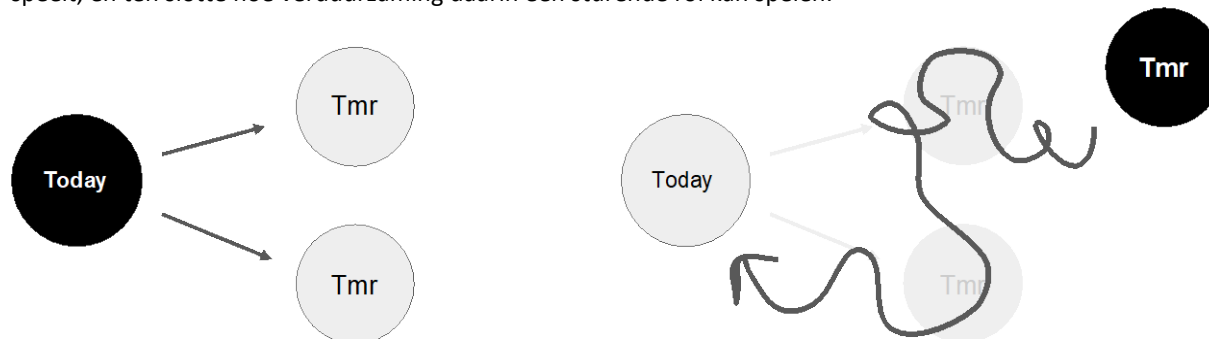
Figuur 2: Links, het forecasten waarbij de huidige situatie wordt geëxtrapoleerd naar de toekomst en er daarop beleidsmaatregelen worden genomen. Rechts, het backcasten waarbij vanuit een bepaalde toekomstige situatie terug wordt gereflecteerd naar vandaag en er daarop beleidsmaatregelen worden genomen (bron: Van den Berghe et al. (2023))

Niettemin, de ene sluit de andere niet uit. Idealiter moet geprobeerd worden de adequate operationalisering van duidelijke stappen en ingrepen te combineren met het rekening houden met een onzekere en impactvolle toekomst. Dit vraagt om een zeer goed begrip van wat er gebeurt op een bepaald bedrijventerrein, hoe deze in relatie staat met andere bedrijventerreinen in Nederland en verder, hoe die vandaag en in de veranderende context een rol speelt, en ten slotte hoe verduurzaming daarin een sturende rol kan spelen.